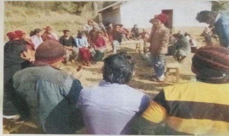
Figure 1 Awareness raising to right holders through REFLECT Center Mobilization