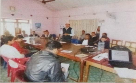
Figure 3 Coordination with stakeholders at district level

ग्रामीण जीवीकोषाध्यक्ष सुदूर तथा प्रशिक्षणको समन्वयक र सर्वांगीण विकास