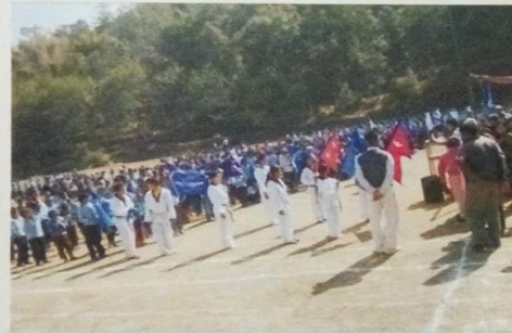
Figure 2 Inter Primary School Level TOUCH running shield competition